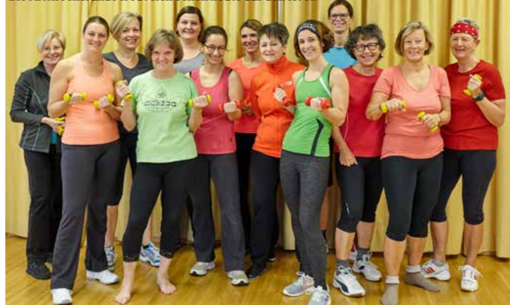
Die Mittwochsrunde freut sich schon heute auf den 18. 9.!

Gerne können Ausbildungen und Fortbildungen auf Kosten des Vereins gemacht werden. Bei Interesse bitte melden, das vielseitige Kursprogramm der Sportunion Oberösterreich ist auch Online ( www.sportunion-akademie.at ) abrufbar!