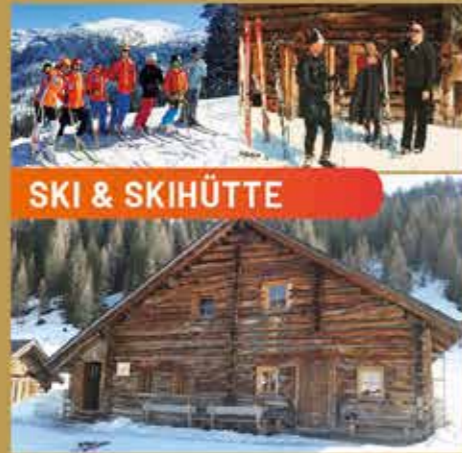
SKI & SKIHÜTTE