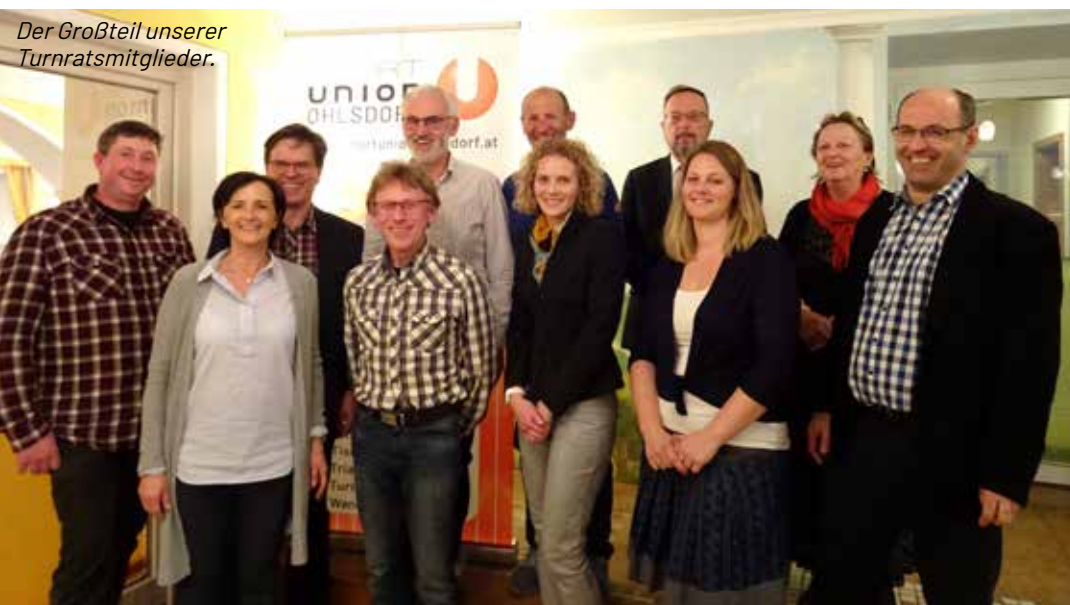
Der Großteil unserer Turnratsmitglieder.