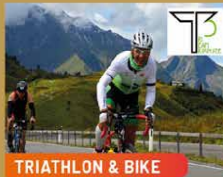
TRIATHLON & BIKE