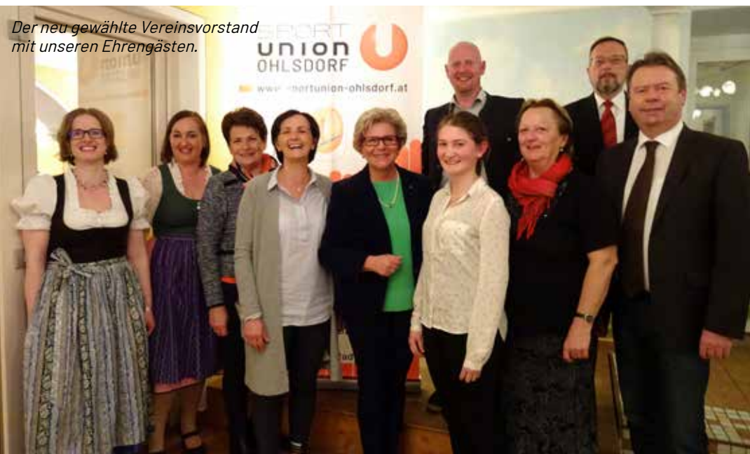
Der neu gewählte Vereinsvorstand mit unseren Ehrengästen.