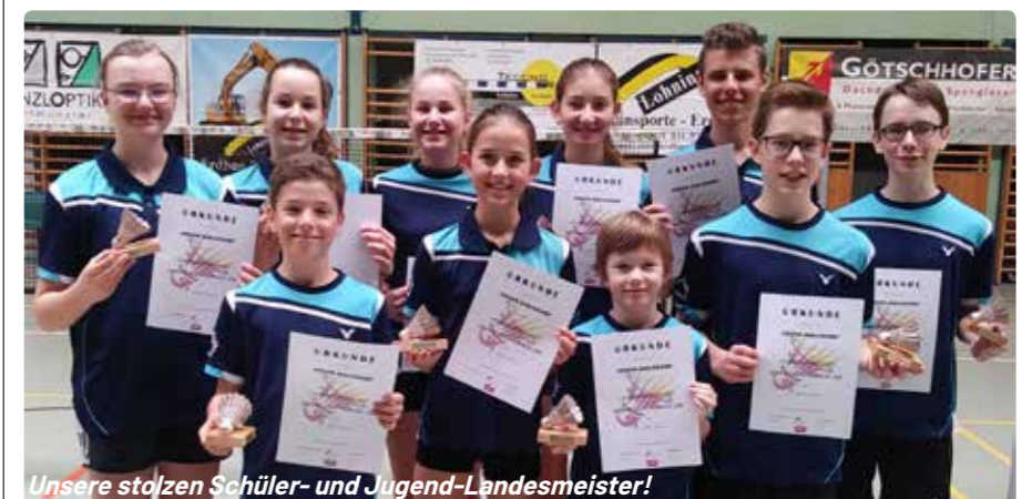
Unsere stolzen Schüler- und Jugend-Landesmeister!

Somit werden beide Nachwuchsmannschaften der Sportunion Ohlsdorf Oberösterreich bei den Österreichischen Meisterschaften vertreten. Vielleicht geht sich ja sogar eine Medaille für uns aus.