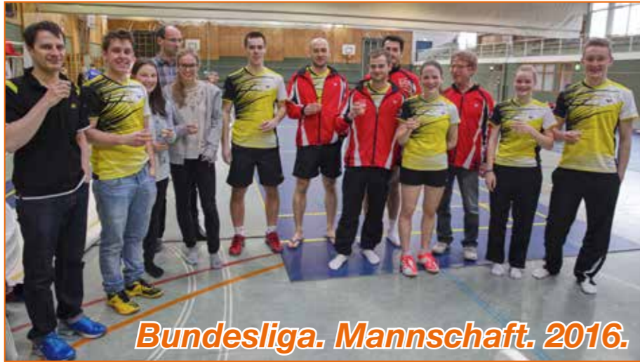
Bundesliga. Mannschaft. 2016.